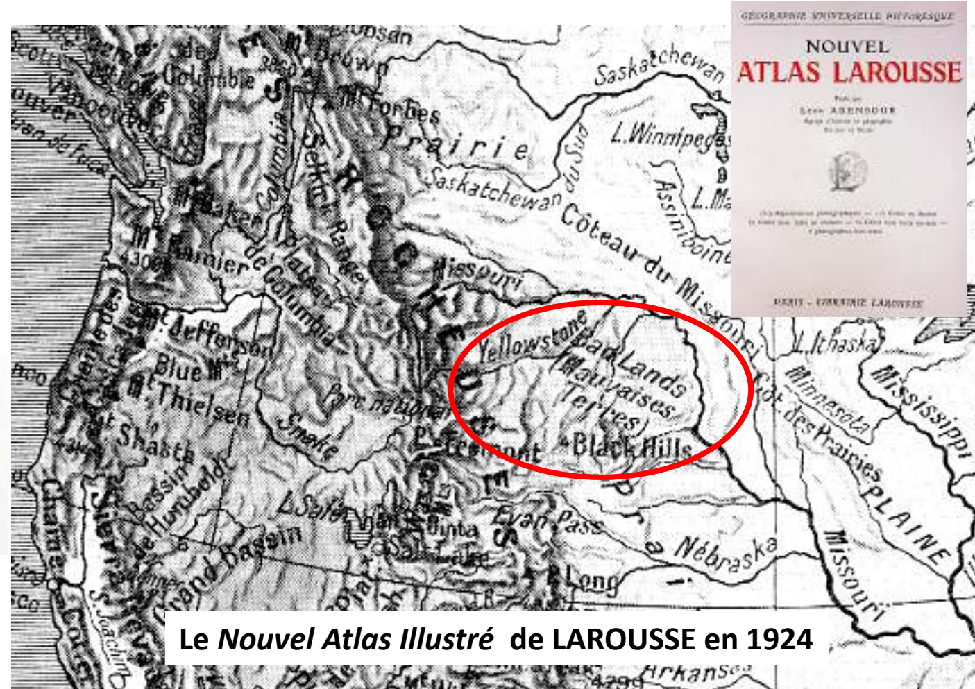
Le Nouvel Atlas Illustré de LAROUSSE en 1924

Depuis le début du 20 ème siècle, « badlands » (mauvaises terres) figure dans les dictionnaires de langue et les atlas en français