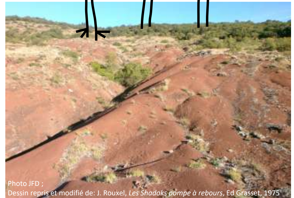
Dessin repris et modifié de: J. Rouxel, Les Shadoks pompe à rebours , Ed Grasset, 1975